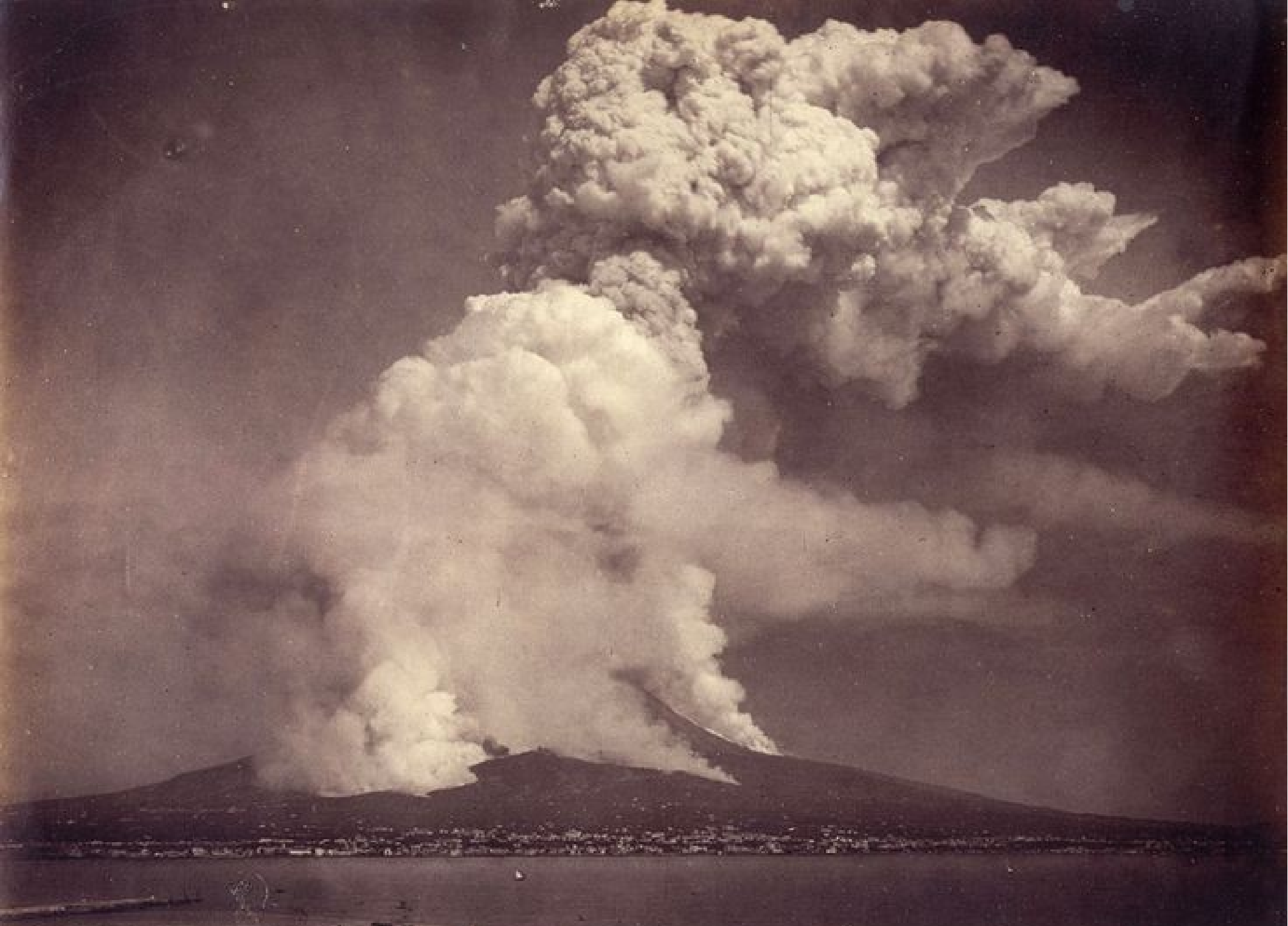
L'Eruzione del Vesuvio. 26 Aprile 1872 ore 3 P.M. V. 6102